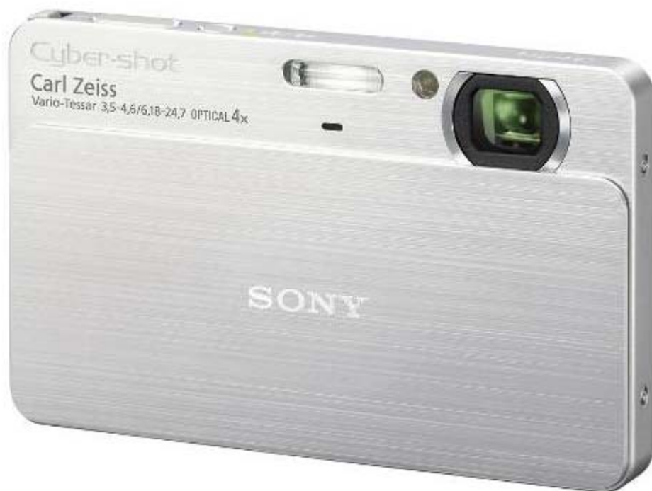
Photo Numérique Cyber-shot DSC-T700S MEMORY STICK DUO