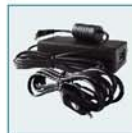
Kit adaptateur secteur K-ACxx