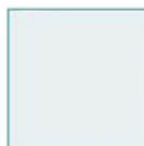
Batterie Li-ion D-LI78