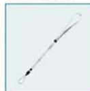
Dragonne en cuir