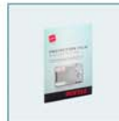
Jeu de films de protection (Ecran LCD 2,5")